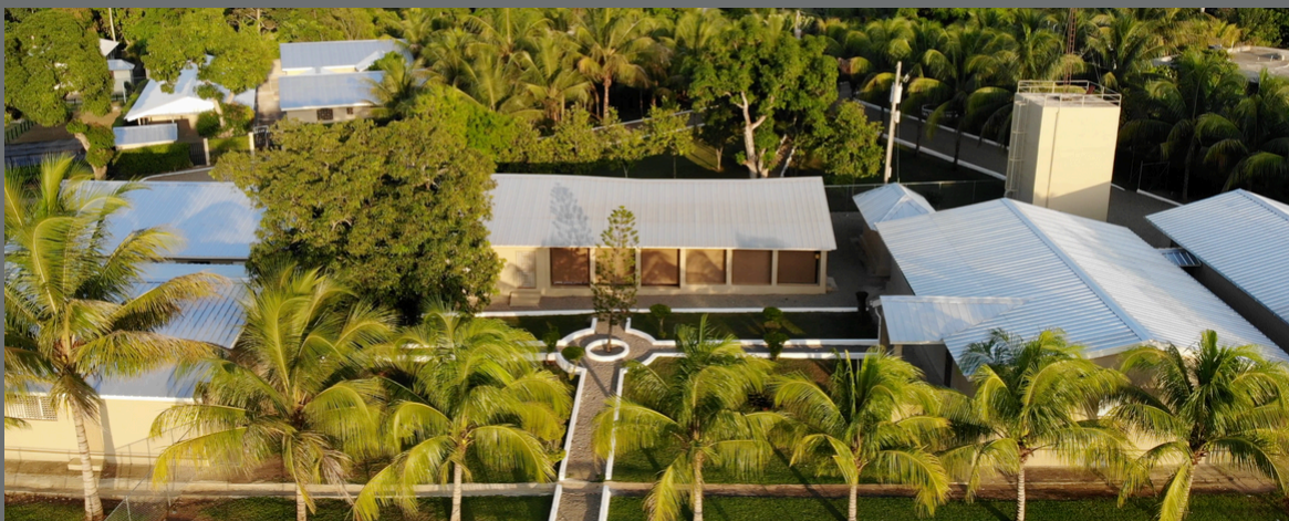
HORNSBY PRAYER & EQUIPPING HUB - DILAIRE, HAITI