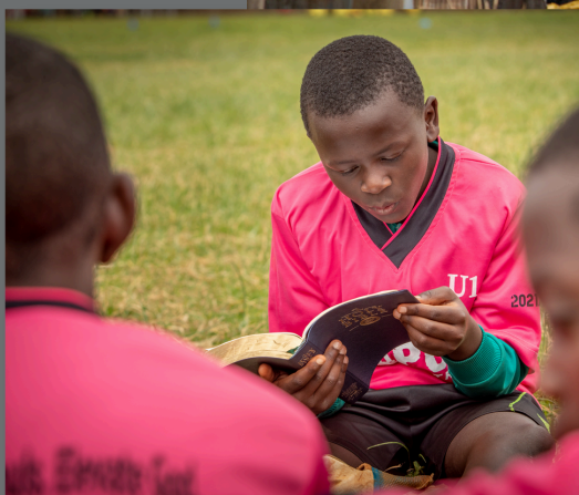
Kawangware Slum, Kenya